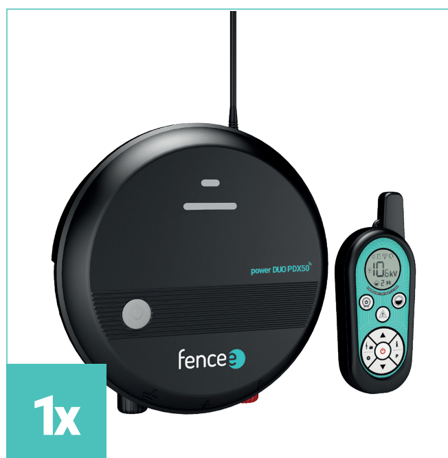
1x Základní RF anténa